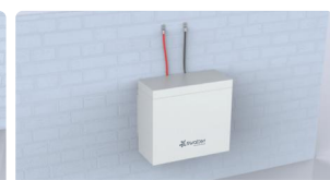
Montado na parede